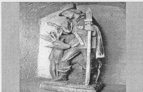
3. November: Hl. Hubertus (um 655-727)